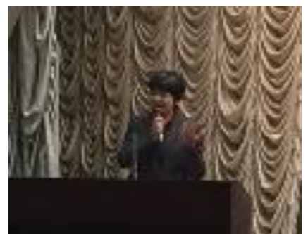
全体会 消費者庁取組報告(板東長官)