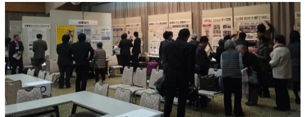
壁新聞交流会の様

日時：2016年2月8日（月） 11：00～16：20 壁新聞交流会 13：00～16：20 全体会・グループ討議 場所：プラザホープ4階大ホール テーマ：『学んで、気づいて、つながって