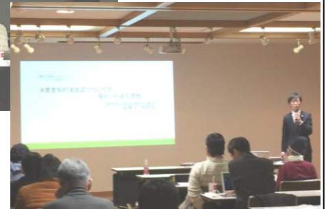
契約解除について説明